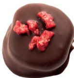
‘Tmavá | ‘Malina