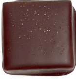
‘Tmavá | ‘Chilli