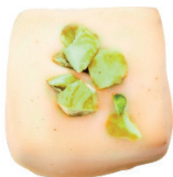
‘Bílá | ‘Pistácie