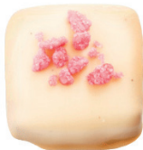
‘Bílá | ‘Růže

Svůdné křupnutí prémiové čokolády v kombinaci pružného želé z hroznového moštu s chutí orientálního koření překvapí svou lahodnou konzistencí.