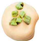
‘Bílá | ‘Pistácie