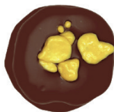
‘Tmavá | ‘Maracuja