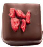
‘Tmavá | ‘Malina