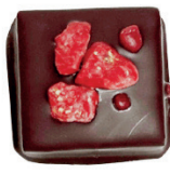
‘Tmavá | ‘Jahoda