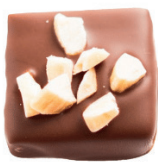
‘Mléčná | ‘Mandle