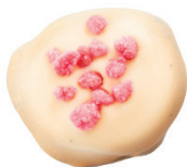
‘Bílá | ‘Růže

Uvnitř Popoku jsou ukryty pečlivě vrstvené celé půlky vlašských ořechů obalené do redukovaného hroznového moštu se směsí orientálního koření, potažené do prémiové čokolády.