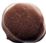
‘Tmavá | Ghilli