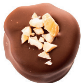
‘Mléčná | ‘Mandle