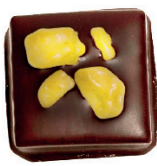
‘Tmavá | ‘Maracuja