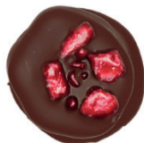
‘Tmavá | ‘Jahoda