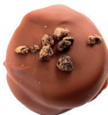
‘Mléčná | ‘Pepř