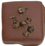
‘Mléčná | ‘Pepř